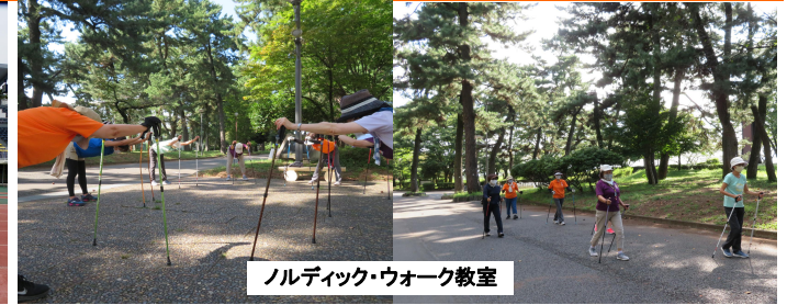
ノルディック・ウォーク教室

いつも当公園をご利用いただきありがとうございます。 県立敷島公園では、各種教室・講座・イベント等を実施しています。10月・11月のスケジュールは以下の通りです。