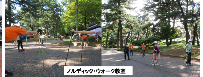
ノルディック・ウォーク教室

いつも当公園をご利用いただきありがとうございます。 県立敷島公園では、各種教室・講座・イベント等を実施しています。3月までのスケジュールは以下の通りです。