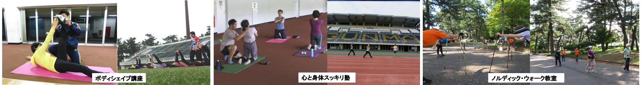
ポディシェイブ講座