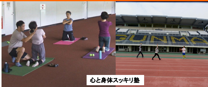
心と身体スッキリ塾