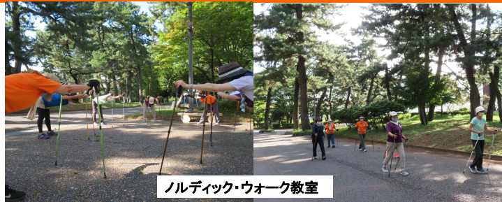
ノルディック・ウォーク教室

いつも当公園をご利用いただきありがとうございます。 県立敷島公園では、各種教室・講座・イベント等を実施しています。10月・11月のスケジュールは以下の通りです。