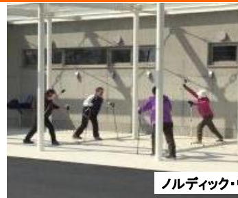
ノルディック・ウォーク教室