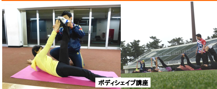
ボディシェイプ講座