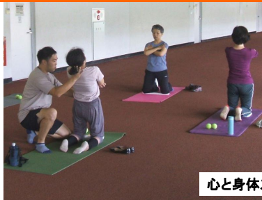
心と身体スッキリ塾