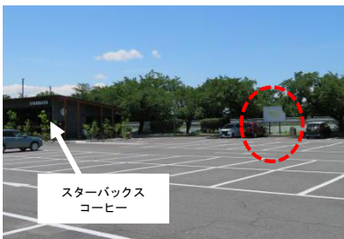
第1駐車場（スターバックス コーヒー北）