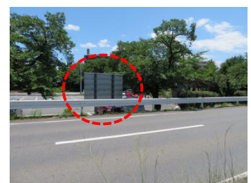
国体道路から撮影