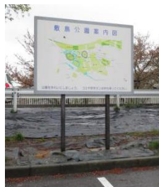
看板正面 ※更新予定