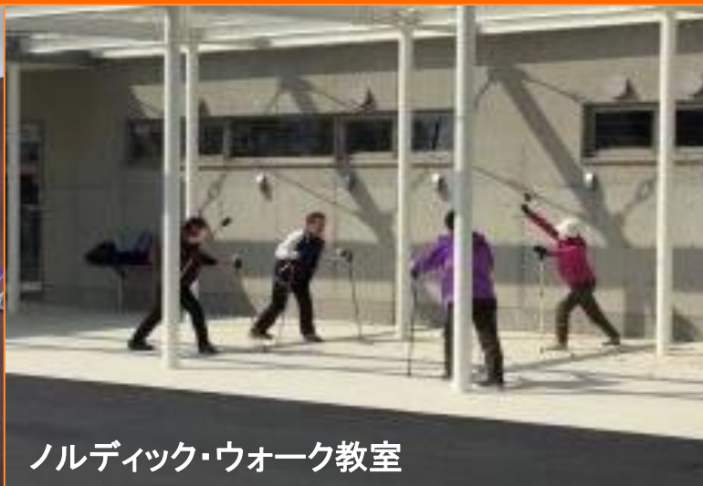
ノルディック・ウォーク教室