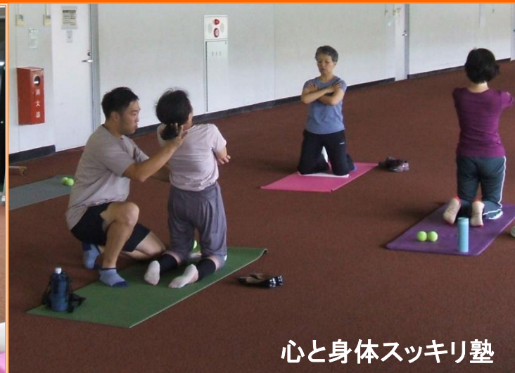
心と身体スッキリ墊