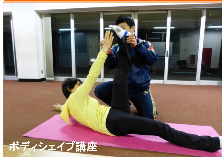
ボディシェイプ講座