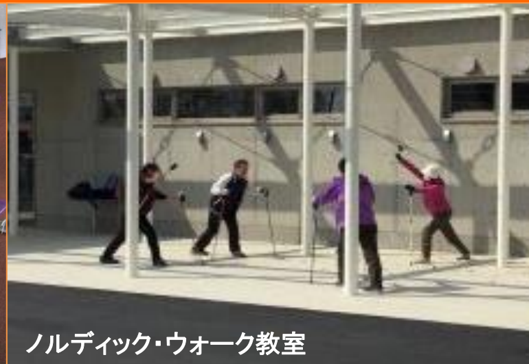
ノルディック・ウォーク教室