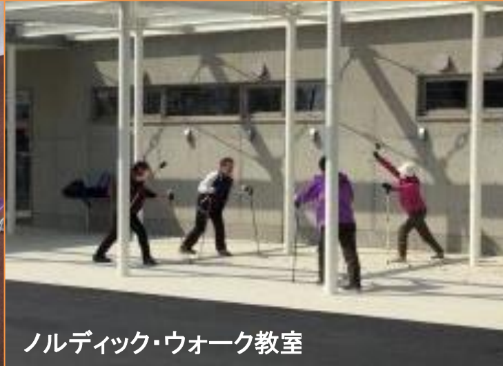
ノルディック・ウォーク教室