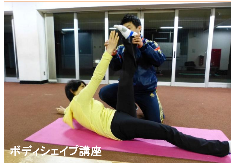
ボディシェイプ講座