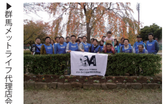
群馬メットライフ代理店会