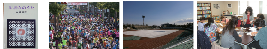
▲本の森おすすり本 【第8折々のうた】 大岡 信著 岩波新書 ▲県民マラソン ※1 スタート地点の様子 ▲養生シート設置状況 ※2 ▲手芸教室の様子 ※3