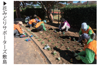
花みどりサポーターズ敷島

敷島公園でのボランティア活動は随時募集しています。活動内容・時間などお気軽にお問い合わせください。