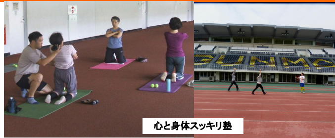
心と身体スッキリ塾