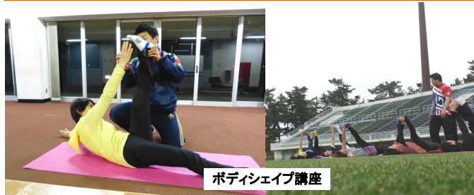
ボディシェイプ講座