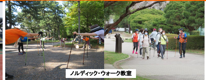
ノルディック・ウォーク教室

いつも当公園をご利用いただきありがとうございます。 県立敷島公園では、各種教室・講座・イベント等を実施しています。7月・8月のスケジュールは以下の通りです。