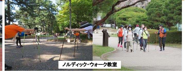
ノルディック・ウォーク教室

いつも当公園をご利用いただきありがとうございます。 県立敷島公園では、各種教室・講座・イベント等を実施しています。4月・5月のスケジュールは以下の通りです。