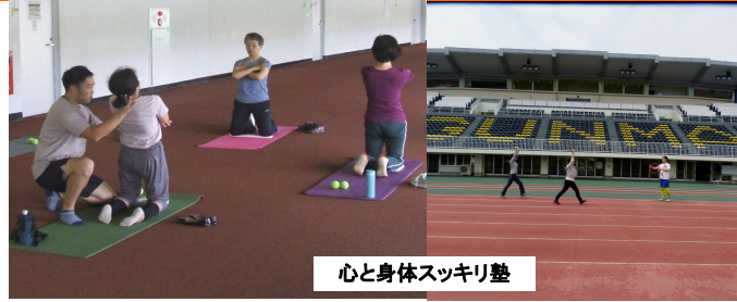
心と身体スッキリ塾