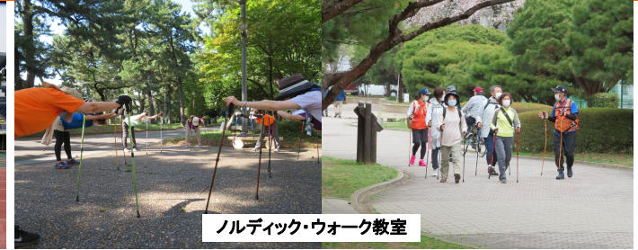
ノルディック・ウォーク教室

いつも当公園をご利用いただきありがとうございます。 県立敷島公園では、各種教室・講座・イベント等を実施しています。3月・4月のスケジュールは以下の通りです。