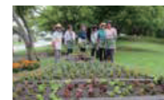
▲県花みどりサポーターズ敷島の皆さん