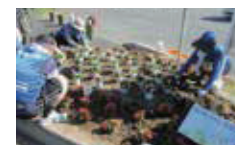
▲J A 共済連群馬の皆さん