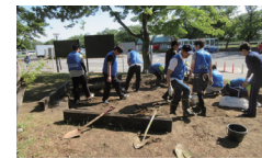
▲J A 共済連群馬花壇づくりの様子