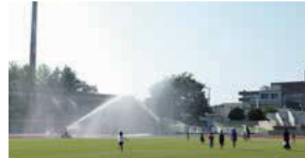
▲天然芝体験 散水の様子