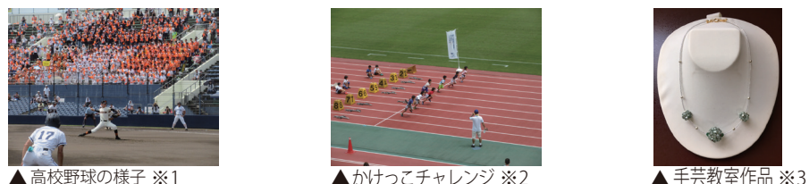
▲高校野球の様子 ※1 ▲かけっこチャレンジ ※2 ▲手芸教室作品 ※3

※詳細内容・料金・お申し込み等は、「敷島公園管理事務所」TEL:027-234-9338(10:00～16:00)までお問い合わせください