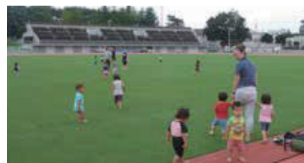
▲天然芝体験の様子