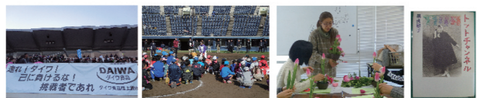
▲ドラマ撮影の様子 ※1 ▲ソフトボール教室の様子 ※2 ▲フラワーアレンジメント教室の様子 ※3 ▲本の森おすす本本【トットチャンネル】黒柳徹子/新潮社

※詳細内容・料金・お申し込み等は、「敷島公園管理事務所」(TEL:027-234-9338)までお問い合わせください