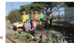
▲花みどりサポーターズ敷島の皆さん