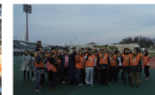
▲ザスパミーティングの皆さん

<ボランティア募集中> 敷島公園でのボランティア活動を随時募集しています。活動内容・時間などお気軽にお問い合わせください。