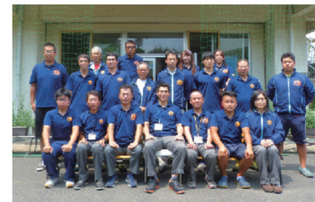
▲敷島パークマネジメントJV一同

新年あけましておめでとうございます。 旧年中は県立敷島公園をご愛顧頂き厚くお礼申し上げます。 本年もより良い公園づくりを目指し、公園従業員一同、精進してまいります。 平成30年最初を飾る出来事として、前橋育英高校が全国高校サッカー選手権にて悲願の初優勝を達成しました。群馬県のスポーツ人口やレベルが年々上がっていると実感します。 また、平成30年4月からは、プロ野球公式戦2試合、高校サッカー関東大会、高校陸上関東大会とレベルの高い大会が目白押しです。 県内県外そして周辺地域からご利用頂き、便利にそして快適に過ごせる様、身を引き締めて公園の管理運営を向上できる様、努力してまいります。