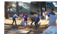
▲J A 共済連群馬の皆さん