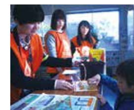
▲敷島公園まつりボランティア(スタンプラリー対応)