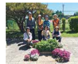
▲花みどりサポーターズ敷島の皆さん