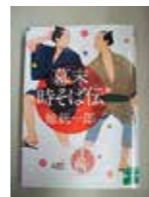
▲本の森おすすりめ本【期末そばだ】 鯨統一郎 実業之日本社文庫