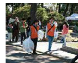
▲敷島公園まつりボランティア(園内清掃)

のべ5人(5月20日現在) 園内のゴミ拾い、草むしり等の活動を行って頂きました。