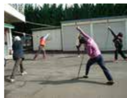
▲ノルディック・ウォーク講習会の様子 ※3